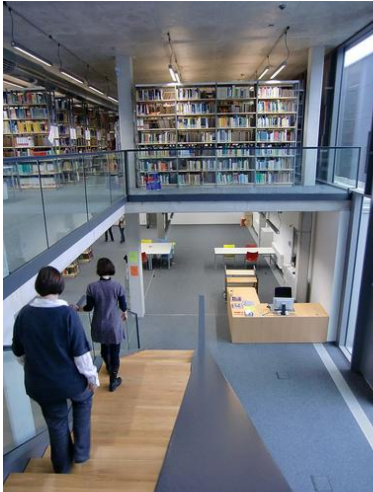
FH Mainz, Bibliothek.

Es folgte eine Fortbildung mit Power Point Präsentation zum Thema Bibliotheken und Web 2.0 mit Patrick Danowski von CERN, Schweiz.